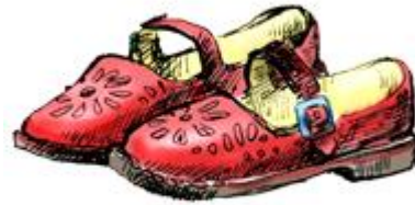
туфли дали-дали – маленькие сандалии