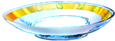
люце-люце – новое блюдо