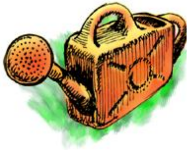
ейка-ейка - для поливания лейка