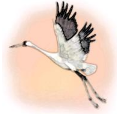
равль-равль - летит журавль