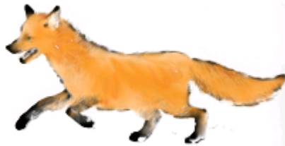
са-са – плутовка-лиса