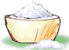
оль-оль – соленая соль