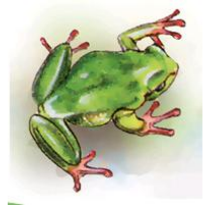
гушка-гушка – зеленая лягушка