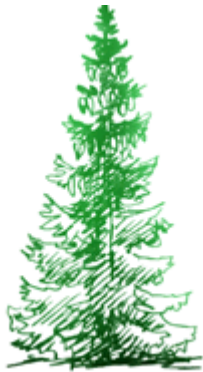
ель-ель – длинная ель