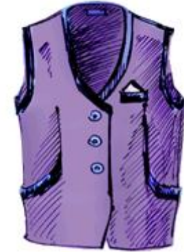
лет-лет – фиолетовый жилет