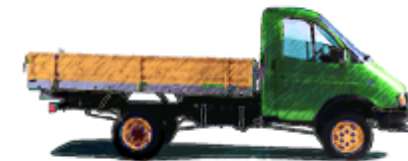
зель-зель – новая газель