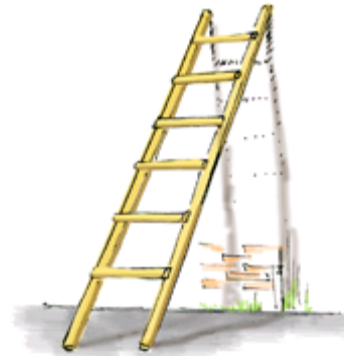
ница-ница – деревянная лестница