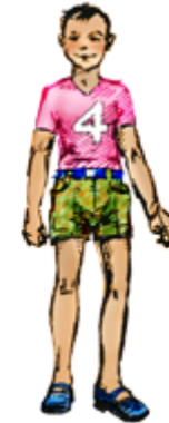
альчик-альчик – веселый мальчик