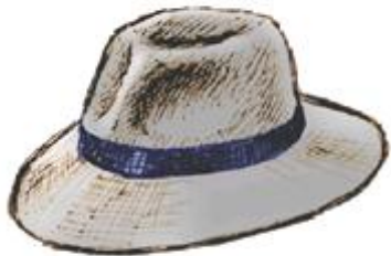
ляпа-ляпа – с полями шляпа