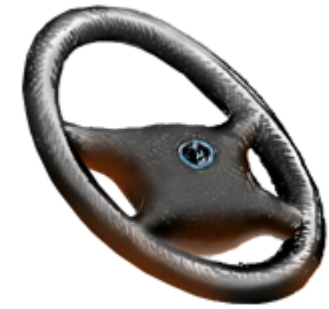
уль-уль – круглый руль