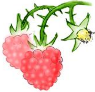
лина-лина – садовая малина