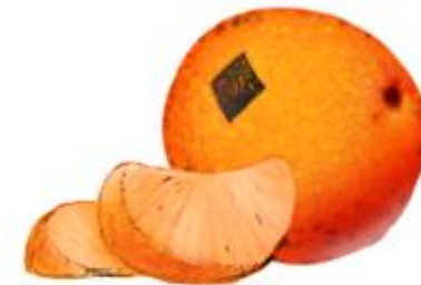
син-син – сладкий апельсин