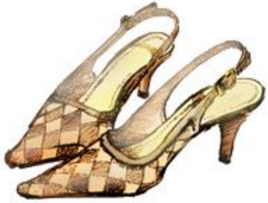
уфли-уфли – модельные