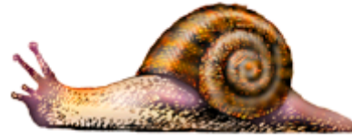
литка-литка – слизкая улитка