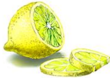
мон-мон – полезный лимон