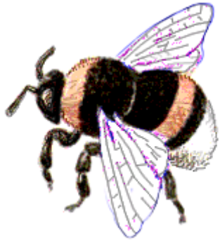
мель-мель – полосатый шмель