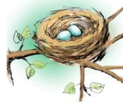
здо-здо – птичье гнездо