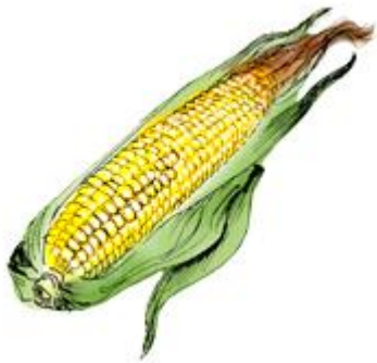
руза-руза – сладкая кукуруза