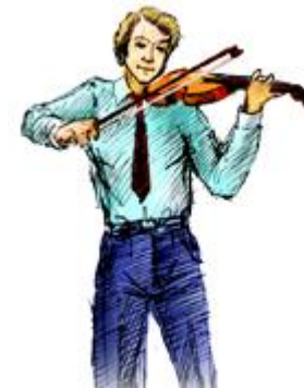
кант-кант – музыкант