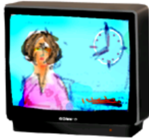
визор-визор – телевизор