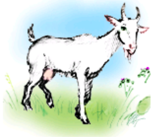
За-за – пасется коза