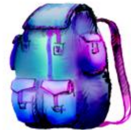
зак-зак – туристический рюкзак