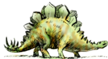
завр-завр – зеленый динозавр