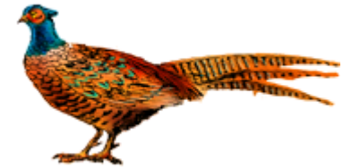
зан-зан – фазан