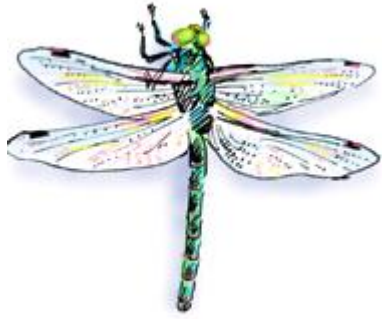
за-за – летает стрекоза