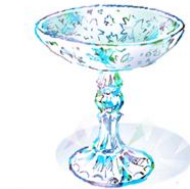
аза-аза – конфетная ваза