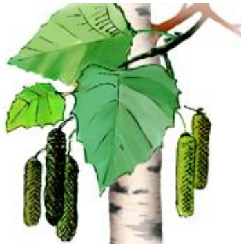
реза-реза – стоит береза