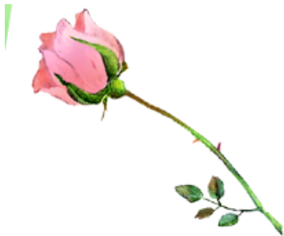
оза-оза – розовая роза